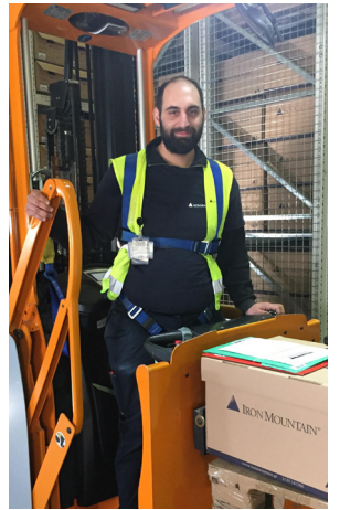
«Յուրախանջյուր Mountain-յի գիտի, որ անվտանգությունը անվիճելի է»: Iron Mountain-ի Անվտանգության բաժին

Իմանալ ավելին. Անվտանգության, ապահովության կամ թմրանյութերի և ակոհոլի ազդեցությունից ազատ աշխատանքային միջավայրի մեր քաղաքականության վերաբերյալ հարցեր ունենալու դեպքում դիմեք ձեր ղեկավարին: